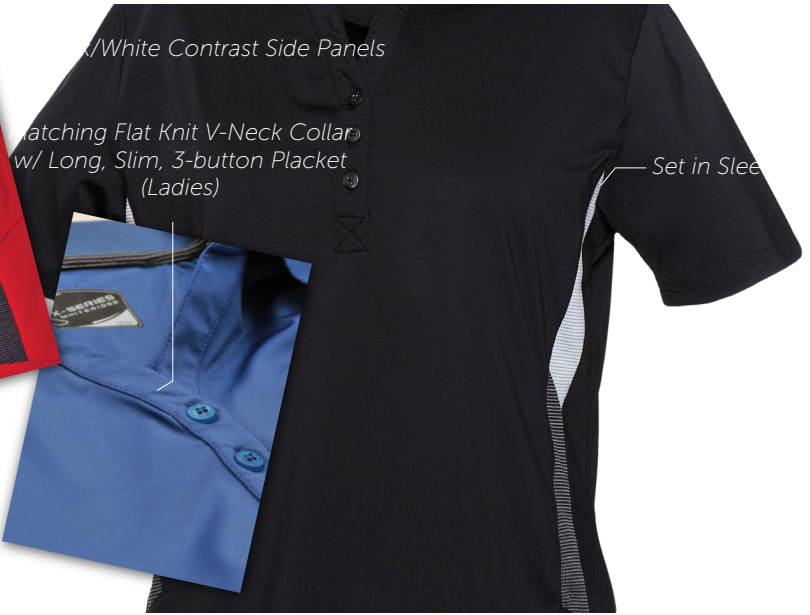
/White Contrast Side Panels